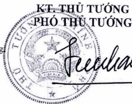
Lê Minh Khái